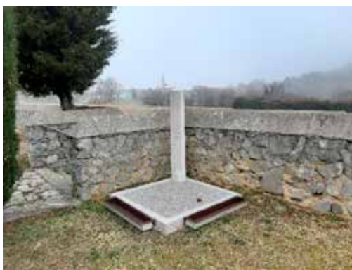
Prostor za raztros posmrtnih ostankov na pokopališču Divača

Čez celo leto kontroliramo stanje elektrike in vode, pri čemer smo pred zimskim časom z namenom preprečevanja zmrzali na vseh pokopališčih občine Divača vodo zaprli. Na vseh pokopališčih smo zamenjali pipe (na potisk), dodali so se novi zalivalniki ter dotrajani so se odstranili.