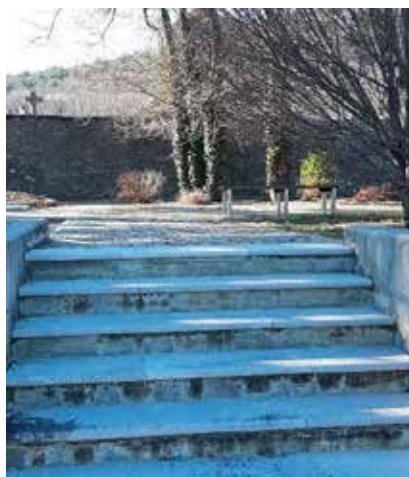
Poti na pokopališču Sežana