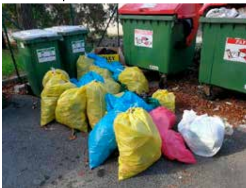
Odpadki, na enem izmed prevzemnih mest akcije Očistimo svet

V septembru 2018 smo se odzvali in sodelovali v akciji Očistimo svet. V sodelovanju z občinami so občane in različna društva ter šole, ki so na akciji sodelovali, podprli z nakupom vrečk za smeti in organizirali odvoz zmrznih odpadkov.