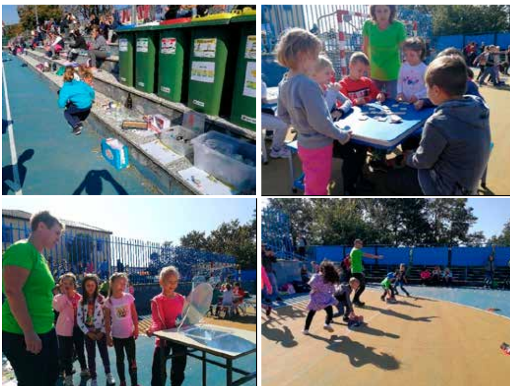
Igre na temo ločevanja odpadkov, OŠ Hrpelje-Kozina

Veliko pozornosti smo namenili tudi delu s šolami in vrtci. Nižje razrede smo obdarili s knjižicami o ravnanju z odpadki (od 1. do 4. razreda), po posameznih razredih (predvsem prvi razredi) smo izvedli delavnice na temo ločenega zbiranja odpadkov (6 delavnic). Zainteresirane višje razrede osnovnih šol ter dijake 2. in 3. letnika srednje šole Sežana, smo popeljali po Centru za ravnanje z odpadki ter jim predstavili delo in naprave (6 delavnic). Vsako leto jih tudi s čim obdarimo. V okviru akcije Očistimo Slovenijo, smo se odzvali povabilu Osnovne šole Hrpelje, kjer smo na delovno soboto izvedli Igre na temo ločevanja odpadkov, na katerih so sodelovali otroci od 1. do 3. razreda.