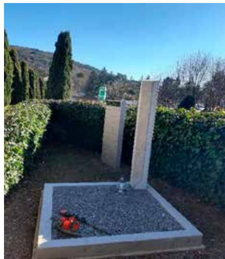
Postavljena nova tabla pri raztrosu