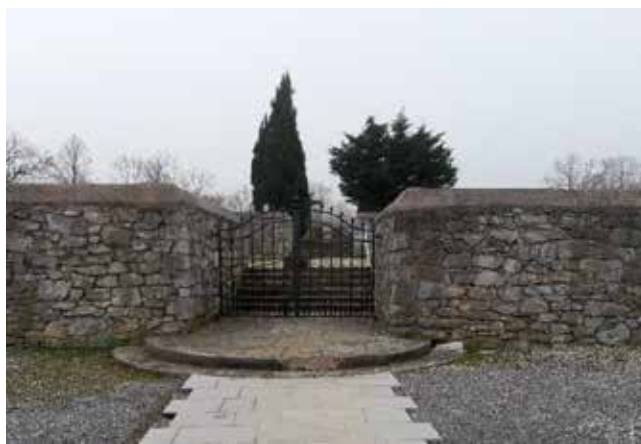
Vhod na pokopališče v Divači