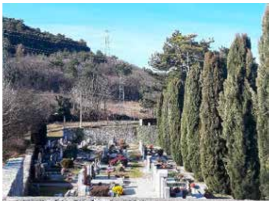
Del starega pokopališča Sežana

Glede na obliko pokopa je bilo največ žarnih pokopov, nekoliko več raztrosov v primerjavi s prejšnjim letom ter še vedno se beleži padeč pri klasični obliki pogreba.