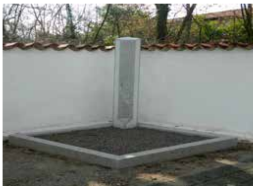
Novo postavljeno mesto za raztros na pokopališču Komen

Čez celo leto kontroliramo stanje elektrike in vode, pri čemer smo pred zimskim časom z namenom preprečevanja zmrzali na vseh pokopališčih občine Sežana vodo zaprli. Na pokopališčih so bile zamenjane pipe, vse pipe so na potisk, dodali so se novi zalivalniki ter odstranili so se dotrajani.