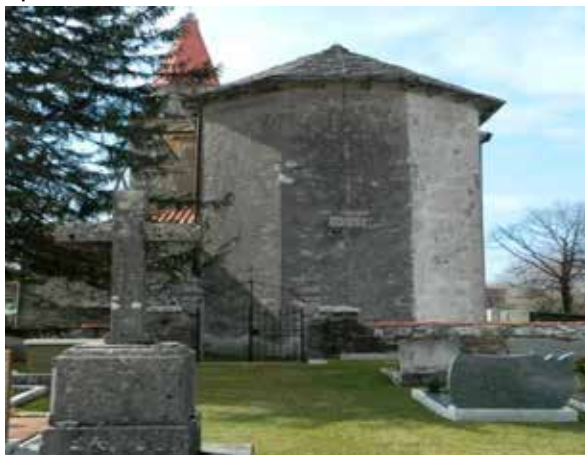
Gabrovica pri Komnu, slikano proti izhodu iz pokopališča

V letu 2018 smo tudi pregledali pokopališča, katera imamo v upravljanju ter si naredili sliko s popisom prostih grobnih polj glede razpoložljivosti pokopališč. V občini Komen so na pokopališču Gabrovica pri Komnu še tri mesta namenjena novim grobnim poljem, smiselno bi bilo razmišljati o širitvi pokopališča.