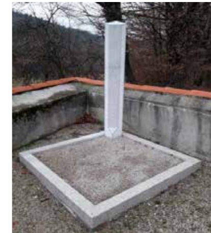
Prostor za raztros posmrtnih ostankov na pokopališču Vreme

Skozi celo leto kontroliramo stanje elektrike in vode, pri čemer smo pred zimskim časom z namenom preprečevanja zmrzali na vseh pokopališčih občine Divača vodo zaprli. Na pokopališčih Vreme, Škocjan, Divača so bile zamenjane pipe (na potisk).