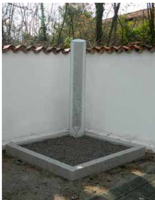
Novo postavljeno mesto za raztros na pokopališču Komen

Skozi celo leto kontroliramo stanje elektrike in vode, pri čemer smo pred zimskim časom z namenom preprečevanja zmrzali na vseh pokopališčih občine Komen vodo zaprli. Na pokopališčih v Volčjem gradu, Kobjeglavi, Gabrovici in Brestovici so bile zamenjane pipe (na potisk).