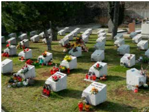
Žarne talne niše na pokopališču Sežana.