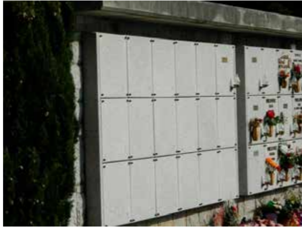
Žarni zid na pokopališču v Sežani.