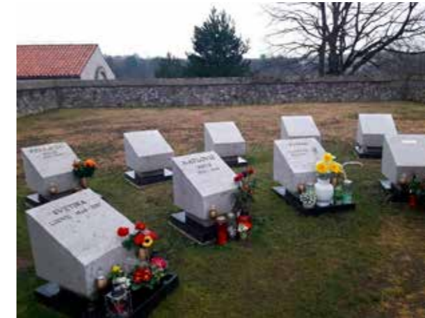
Žarna talna obeležja na pokopališču v Divači

Na pokopališču v Divači smo postavili 14 talnih žarnih obeležij, od tega jih je prostih še 5.