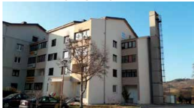
6. Energetska sanacija večstanovanjskega objekta Senožeče 82a - streha in fasada