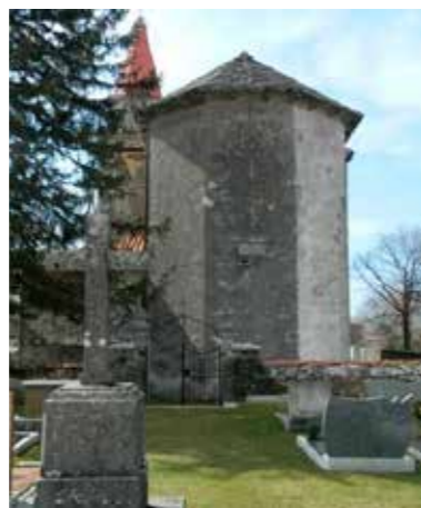
Gabrovica pri Komnu, slikano proti izhodu iz pokopališča

Za lažjo predstavo stanja pokopališč, smo naredili posnetek stanja in popisali prosta grobna polja. V občini Komen so na pokopališču Gabrovica pri Komnu še tri mesta namenjena novim grobnim poljem, smiselno bi bilo razmišljati o širitvi pokopališča.